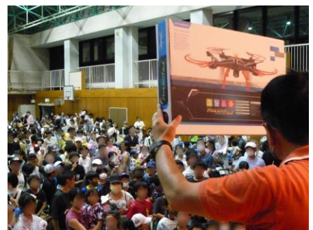
特賞のドローンは、誰の手に？

というわけで、反省点も数多くありつつ、4年ぶりの五常夏祭りはひとまず大盛況のうちに幕を閉じました。