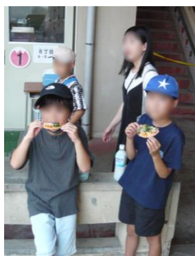
たこせん、サイコー！

この曲の振付を担当した地元の盆踊りチーム「スターダスト河内」の面々から、7月初週の五常子どもいきいき広場で、手取り足取りレクチャーを受けたばかり。