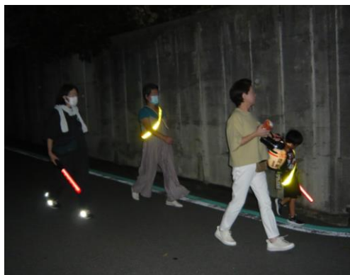
拍子木を打ちながら、回ります

8班に分かれ、自宅周辺をパトロール。二日目は、おのおの一日目の解散地点に集合し、パトロール終了後は、さくらぎ街集会所へ