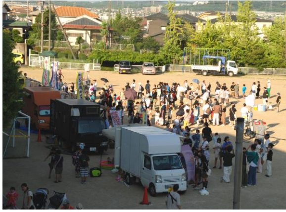
校庭にずらりと並んだ、キッチンカー

自前で調理するのに比べ値が張ることから、さほどの売上は見込めないと踏んで、台数を抑え