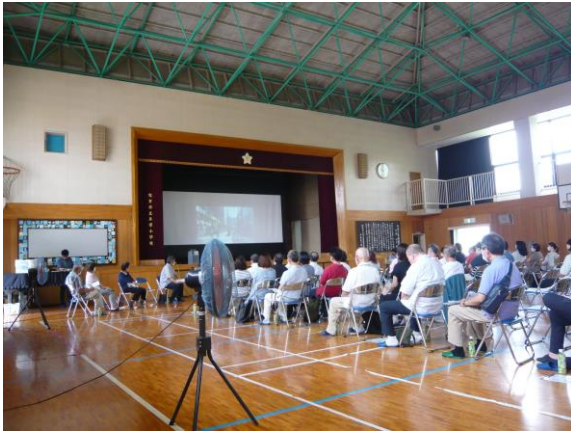
『きずな町物語』 上映中

中の一篇、「わたしはダメされない! その思い込みが落とし穴」というタイトルです。劇中では二人のヒロインが電話を介し、それぞれ架空請求、還付金詐欺の標的になり、まんまとお金をだまし取られそうになります。その電話が怪しいことは観客には一目瞭然なのですが、いざ自分が当事者となると、そうはいかないのではありません。特殊詐欺の被害を防ぐには、覚えのない相手には「安易に電話をかけない」、「電話に出ない」、これがなにより大切です。右の動画は、インターネットやYouTubeで、どなたでも視聴可能ですので、『きずな町物語』で検索してみてください。また、当コミュニティのホームページには、今回の講義資料を掲載中(7/3付・新着情報)。本紙前号で取り上げたサポート詐欺をはじめ、様々な特殊詐欺の被害を防ぐノウハウが満載です。防犯委員以外の方も、ご活用ください。