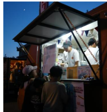
夜店の風情は、また格別