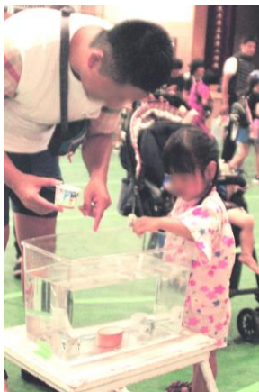
パパの指南で一円玉おとし

夏祭りといえば盆踊りが付き物ですが、今回は体育館でのアトラクションとして全員参加型の盆踊り大会を用意しました。