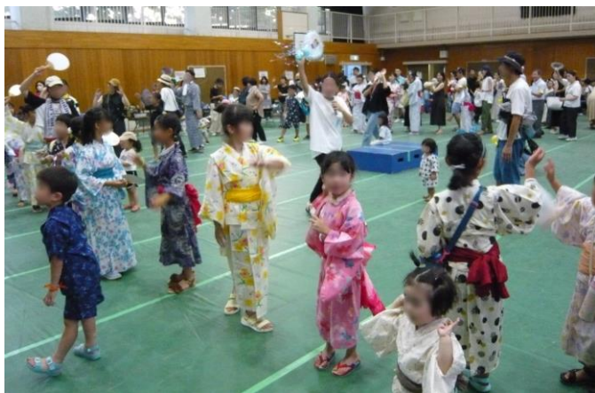
踊れや踊れ、輪になって踊れ ～ 盆踊り大会

夏休みに入って間もない7月22日の土曜日、待望久しかった五常夏祭りが帰ってきました。実に4年ぶりの開催です。