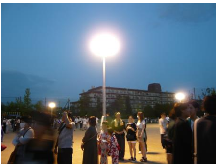
バルーンライトに浮かぶ、夜の校庭

もうひとつ、今回初のお目見えとなったのが、バルーンライトです。これまでの提灯に代わり、夜の校庭をライトアップ。