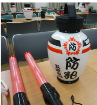
パトロールセット