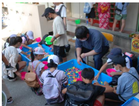
スーパーボールすくいも、夏の定番

夏祭りといえば盆踊りが付き物ですが、今回は体育館でのアトラクションとして全員参加型の盆踊り大会を用意しました。