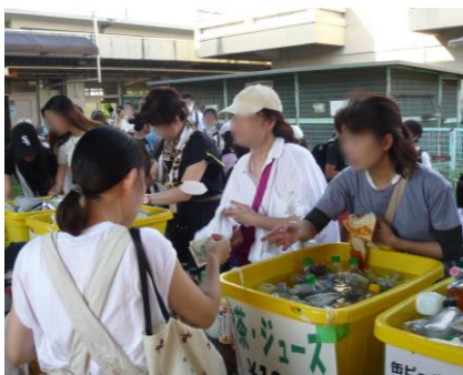
飲み物売場も、大忙し

ほかにも「エビカニクス音頭」、「ジンギスカン」等々、舞台のスクリーンに映し出される動画に合わせて踊りまくりました。