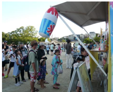
お客さんは引きも切らず

気味にしたのですが、案に相違して、どのお店にも大行列。来年以降もキッチンカーを呼ぶなら、台数を増やし需要を分散する必要があります。