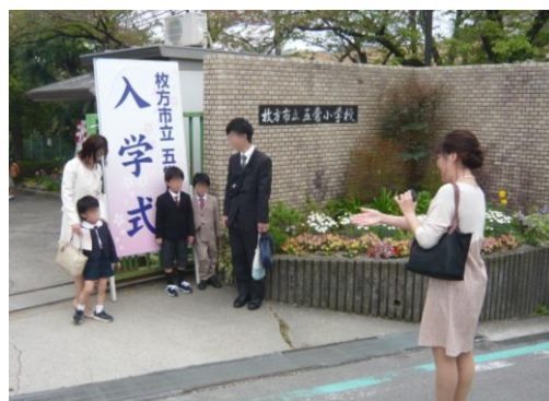
これも一生の記念です

保護者の方と連れ立って登校すると、式の前には正門の前などで、やや緊張の面持ちを浮かべながら記念写真に収まっていました。