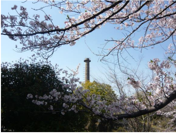
ベストショットな1枚

今年は桜の開花が早く、見ごろを過ぎてしまうのが心配されましたが、すべり込みセーフ。お天気にも恵まれて30人以上の方が