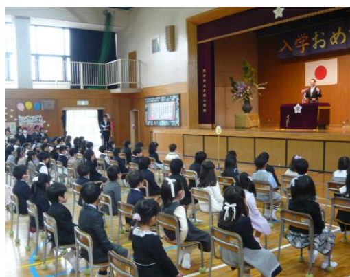
入学早々、お行儀は百点満点

が経つにつれて、若干からだが斜め向いたりもしていましたが、それもご愛嬌 あいきょう です。