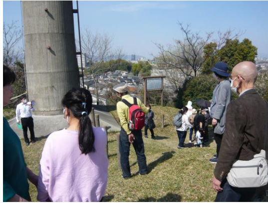
いにしへの香里の地に思いをはせて

来場され、思い思いのアングルで写真を撮ったり、共催の枚方市人権政策室による煙突山の歴史解説に聴き入ったり、うららかな春の一日を楽しんでおられました。 この日も無料配布された人権制作室発行の「枚方市平和(戦争遺跡)ガイド」によれば、ここ妙見山は陸軍の工場敷地の北西端に位置していたようです。