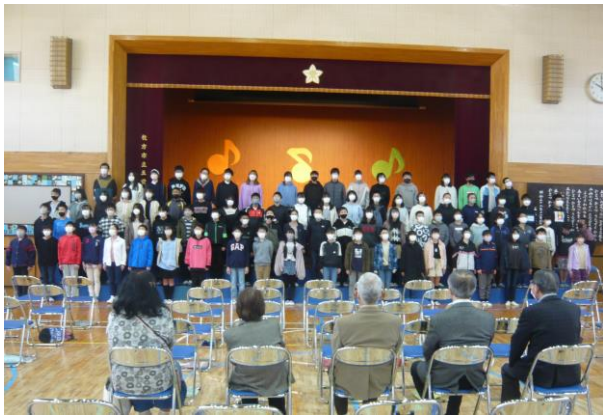
この上ない、歌の贈り物