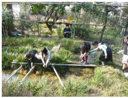
思い思いの場所に放流

会の4年生から6年生が、ホタルの幼虫とそのエサになるカワナを放流しました。いま羽化しようとしているのは、その時の幼虫たちです。