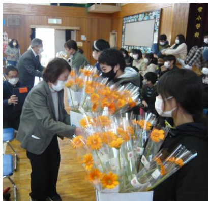
卒業生にはガーベラを一輪ずつ

戦後間もなく、遊び道具に事欠く時代のこと、野球用具を買ってほしいと校長先生に直訴したところ、忘れた頃にお声がかかり、職員室を訪ねてみるとバットにボール、グローブ一式が…。その時の飛び上がりっぱかりのうれしさは、75年以上たった今でも忘れられない、と。