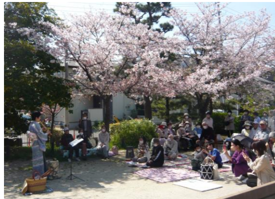
純邦楽、ジャズ、歌謡曲まで自由自在

上のガイドブックは、枚方市のホームページからもダウンロード可能ですので、ぜひ一度ご覧いただければと思います。 *