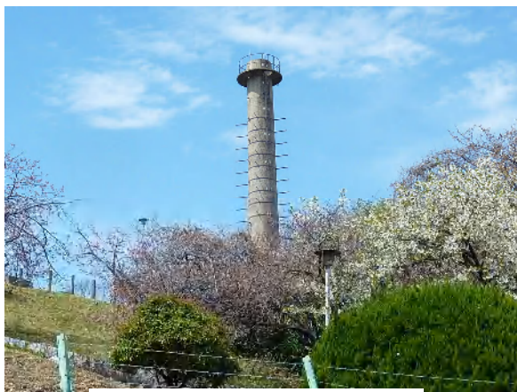
エントツの周りの2種類の桜

ここ数年、桜の開花が早まり、まつり当日に桜が残っているかを心配することが続いています。しかし、煙突山の入口付近の桜は染井吉野、頂上斜面付近は山桜で、開花時期が異なることから、長期間さくらを楽しめる場所となっています。