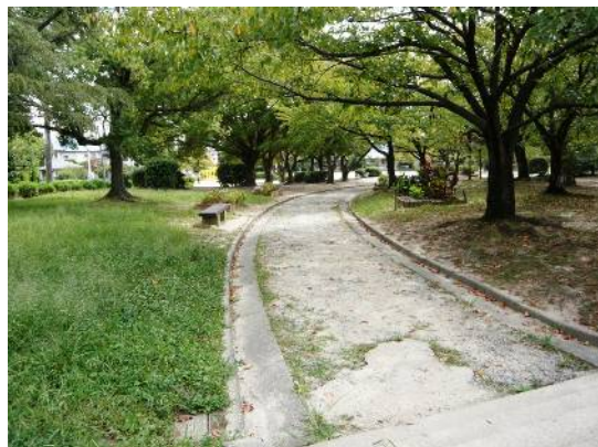
樹林散策路スペース

このように西公園は、五常校区の皆さんの貴重な空間となっています。これからも誰もが西公園を楽しめるよう、マナー(ペットの糞やごみの持ち帰りなど)を守って、公園を楽しんでいただきますようお願いいたします。