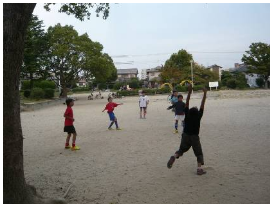
広場スペースで遊ぶ子ども達

児童公園スペースには直径1mのコンクリート製田筒(ヒューム管)が2本並んでいて、「まるまる公園」という通称の由来とも言われています。ここでは、午前中から保護者の方に連れられた赤ちゃんから3〜4歳くらいの幼児が、砂場遊びやブランコを楽しんでいます。時には保育園の子どもたちも