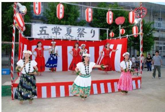
会場を盛り上げるフラダンス

この夏祭りは校区の皆様のご協力を強め、安心して住める地域作りの一環として実施しているもので、今年も校区の皆さんと一緒に手作りで開催することができました。模擬店の食べ物やゲームの価格を安価に設定しているため、校区の小さなお子様や小学生など、多く