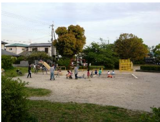
幼児に人気の児童公園スペース

千5百㎡のかなり広い公園です。公園の北側は楕円形広場、これに続いて樹林と散策路のゾーンがあり、その南側には広場スペースとブランコ、滑り台、砂場等のある児童公園スペースが配置され、周囲には桜や楠が大きく育っています。