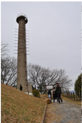
開の桜でしたが、今年は三月の寒さが...

五常校区コミュニティ協議会の四季行事のトップをきって、今回で2回目となる「煙突山の桜ツアー」が4月3日(日)に開催されました。昨年は満