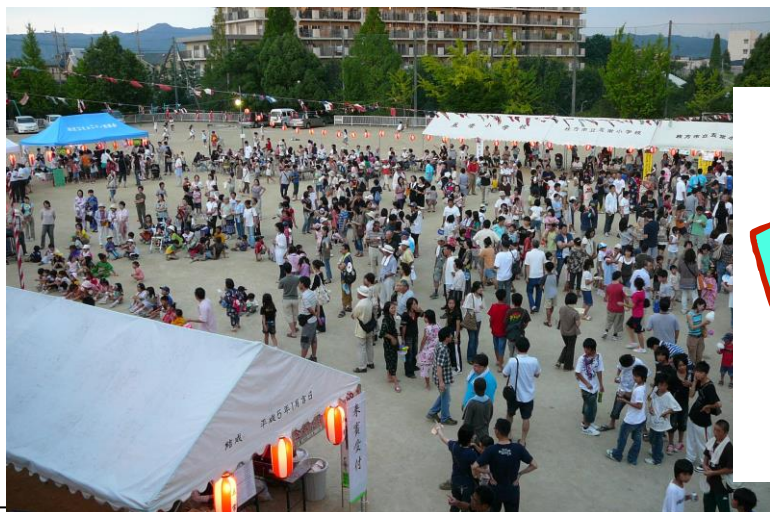
昨年（平成20年）の第1回夏祭りの様子