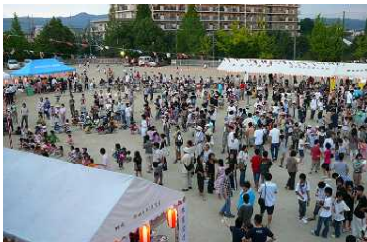
昨年の第1回夏祭りの様子