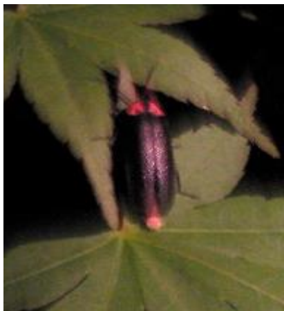
(五常小で観察されたホタル) 6月4日撮影

地域の皆様には昨年来、バザー品や毛布などを提供していただき本当にありがとうございます。地域・学校・保護者の有志で始まったこの活動も、地域の皆様の温かい励ましや子ども達のパワー、そしてそれを支える保護者の皆様や学校の先生方のご協力を受けて、確実に大きな人々のつながりの輪となっております。 また、香里団地解体工事会社のご好意と園芸専門家の方のご協力により処分予定であったC地区の植物をこじよトープに移植することが出来ました。 香里団地は姿を変えてもそこで育まれた自然は大切に残していきたいと思