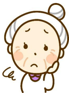
ひとり暮らし の不安

民生委員・児童委員、主任児童委員には「守秘義務」があり、あなたの秘密は必ず守ります。お気軽にご相談ください。