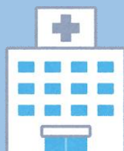
早めに医療機関へ