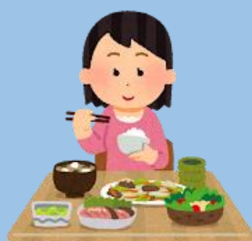
バランスの取れた食事