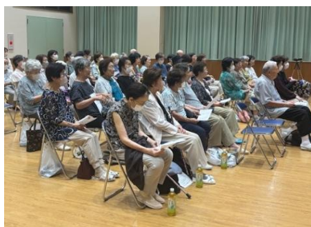
美しい音色に 会場全体が包まれます

最後に、ハンドベルに合わせて「ふるさと」を皆さんで歌い、ハンドベルコンサートは幕を閉じました。