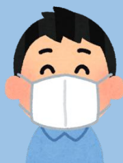
咳エチケットの徹底